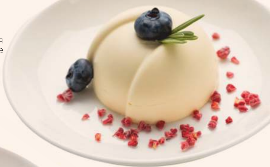
Торт Манго & Маракуйя Mango & Passion Fruit Cake