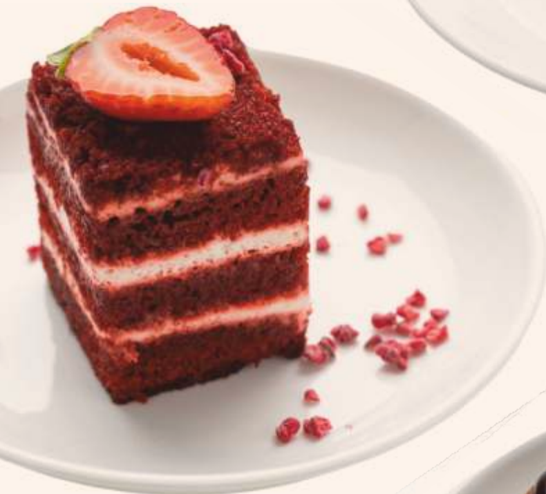
Торт Красный бархат Cake Red velvet