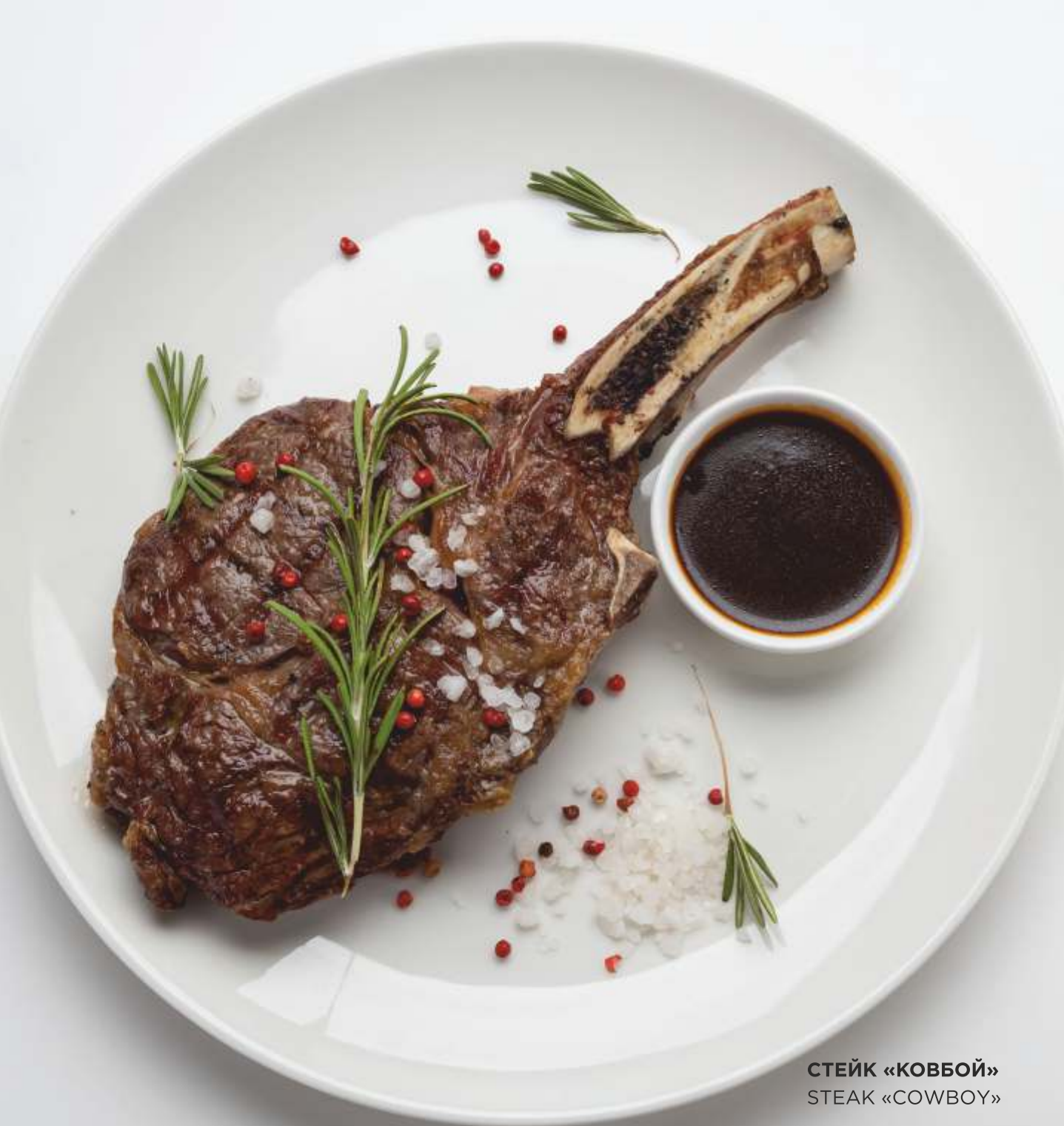
СТЕЙК «КОВБОЙ» STEAK «COWBOY»