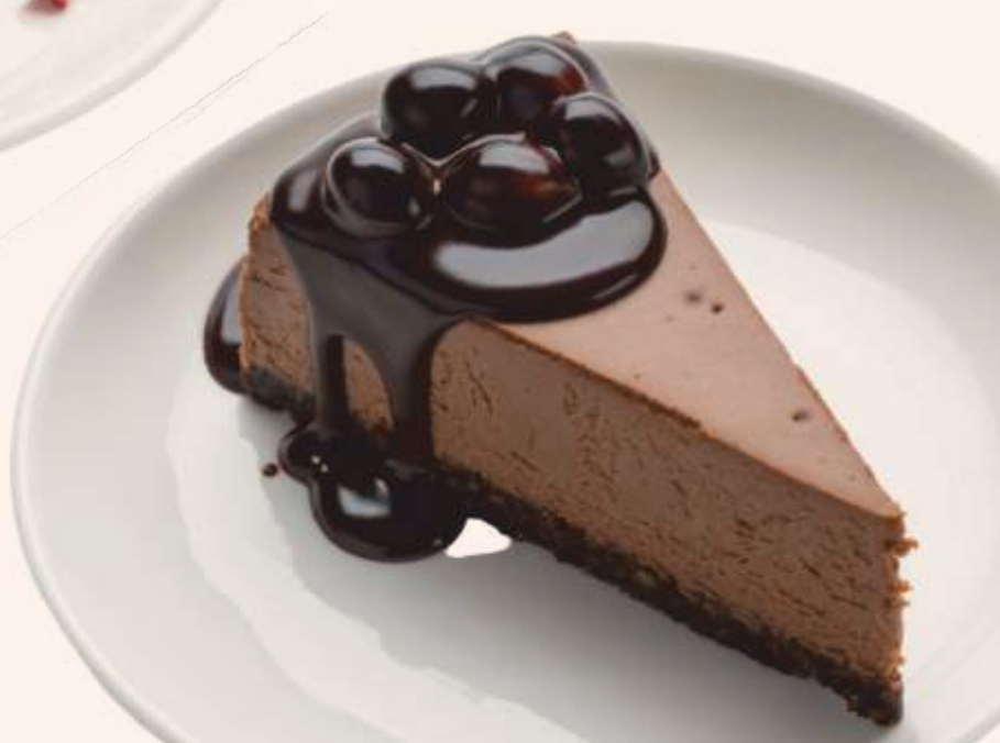
Чизкейк шоколадный Chocolate Cheesecake